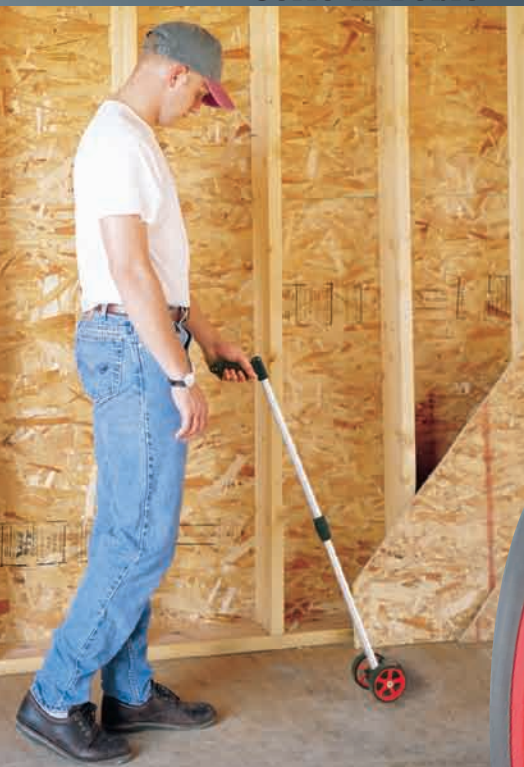
Serie 18 Doble