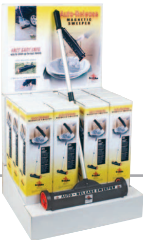
Display für 13 Geräte MS16-13

Die Reinigung wird mit dem Auto-Freigabe-Magnetkehrer noch einfacher. Die 16-Zoll-Magnetscheibe des Kehrs zieht eisenhaltiges Material an und gibt es durch einfache Linksdrehung und Ziehen am Griff frei. Nie wieder Rückenschmerzen oder Bücken. Seine innovative Konstruktion ist rostfrei, einfach zu verwenden und verhindert Verletzungen, da kein direkter Kontakt mit angezogenem Material besteht.