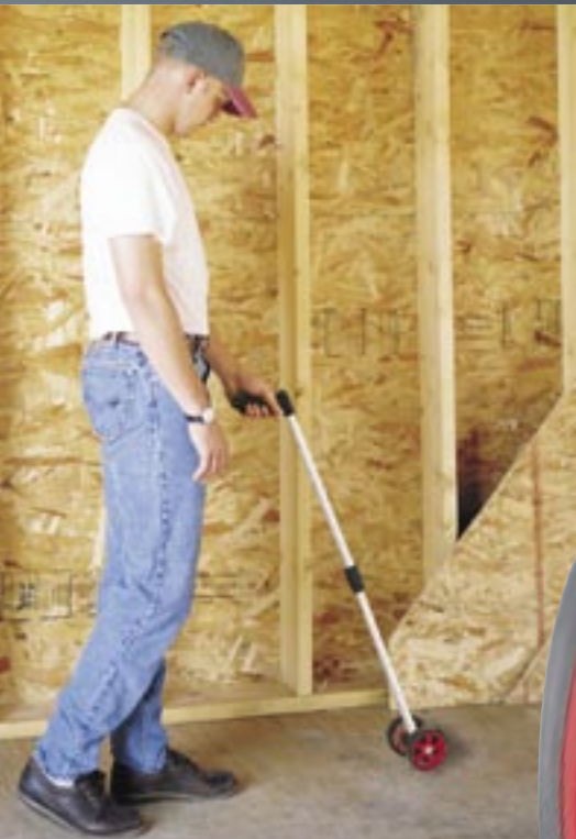
Serie 18 Dual